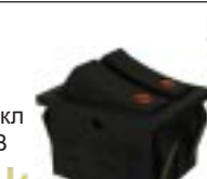
Q-651 тип II