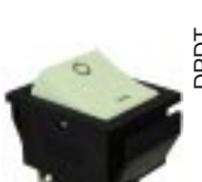
Q-1062 тип II