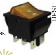
Q-574 тип I