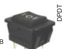
Q-1313 тип II