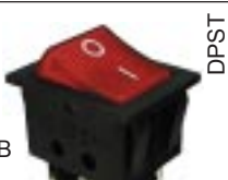
Q-239 тип II