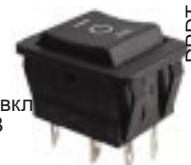
Q-1260 тип I