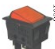
Q-1077 тип II