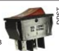
Q-1726 тип II