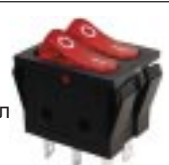
Q-1060 тип I