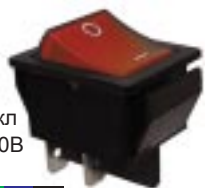
Q-268 тип I