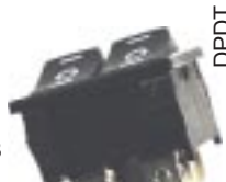
Q-1046 тип II