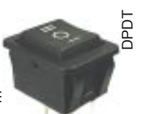
Q-1093 тип II