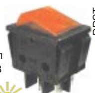
Q-2524 тип I