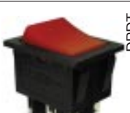
Q-1254 тип II