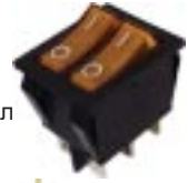
Q-241 тип I