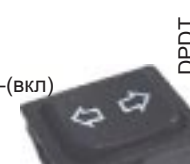
Q-1519 тип I