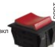
Q-1255 тип I