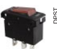
Q-1404 тип III