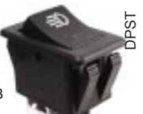
Q-1073 тип II