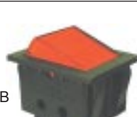
Q-355 тип II