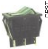
Q-242 тип I