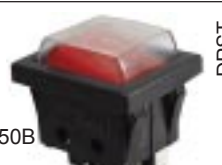
Q-336 тип II