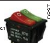
Q-1086 тип II