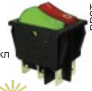
Q-1081 тип I