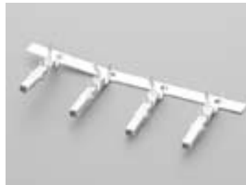
Контакт для разъема