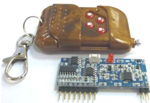
Рис.1 Общий вид

Это устройство предназначено для построения радиоэлектронной аппаратуры в области разработок и модернизации различных радиотехнических и бытовых устройств. Устройство представляет себе модуль 4-х канального дистанционного управления 433МГц.