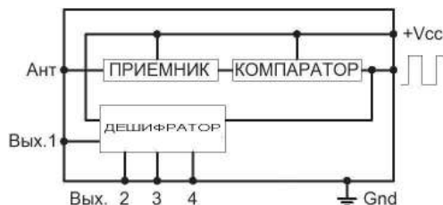
Рис.2 Структурная схема приемника