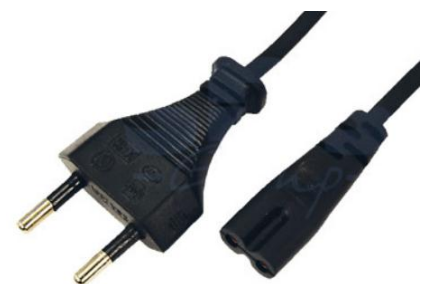
Артикул Q-3069 (прямой)