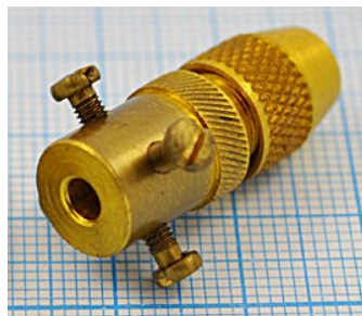
отв. диаметр 3,5мм