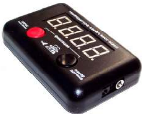
Рис.1 Общий вид устройства