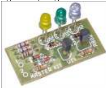
Рис.1 Общий вид устройства

Индикатор позволяет контролировать состояние аккумуляторной батареи автомобиля и работоспособность реле-регулятора, что предотвратит преждевременный выход из строя аккумулятора и поможет сэкономить Вам Ваши деньги. Также с помощью этого тестера можно проверять и другое электрооборудование Вашего автомобиля.