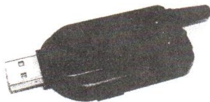
Рис.1. Общий вид поставляемого USB-EDGE модема

Более того, поставляемые с модемом гарнитура и программное обеспечение, позволяют использовать данный модем как полноценный мобильный телефон с возможностью приёма/совершения звонков и работы с SMS.